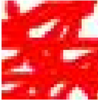
Abbildung 1.2: sdöfm psdf spdfo spdfo spdofk spdof spdofk spdofk spdof